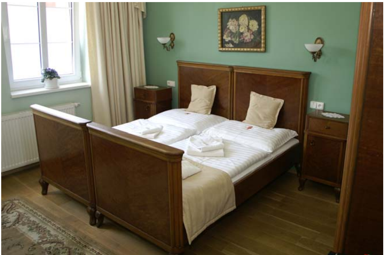
14 - Veltlín