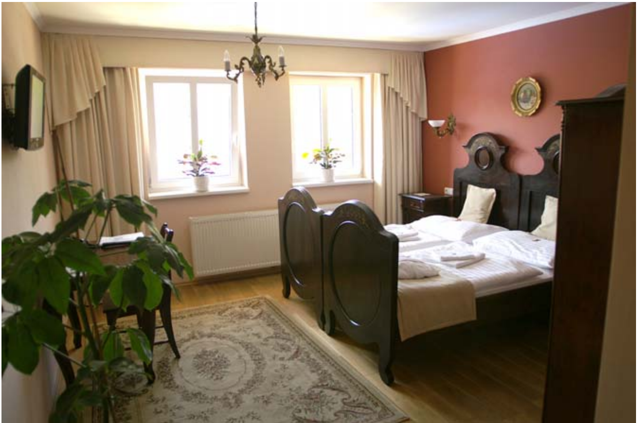
23 - Vavrinec