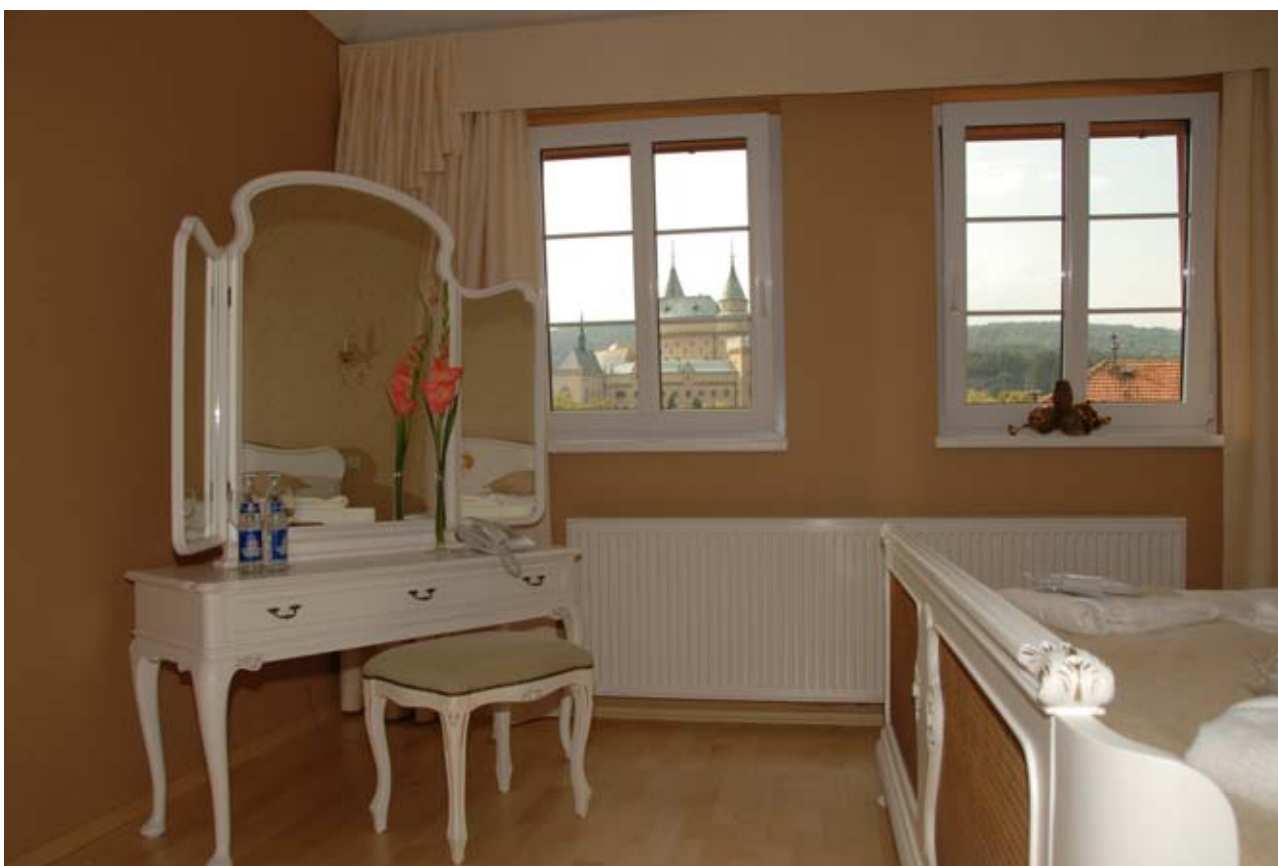
26 - Svadobný apartmán