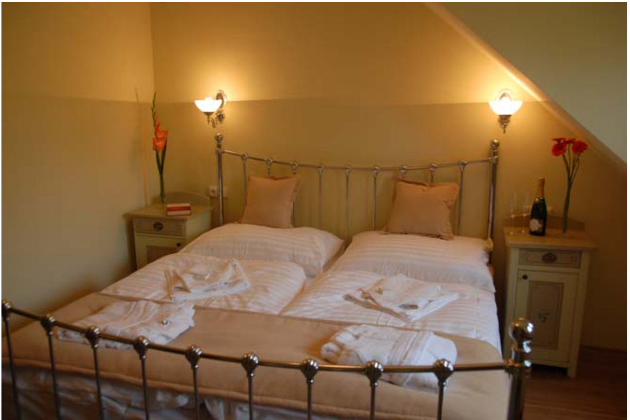
21 - Breslava