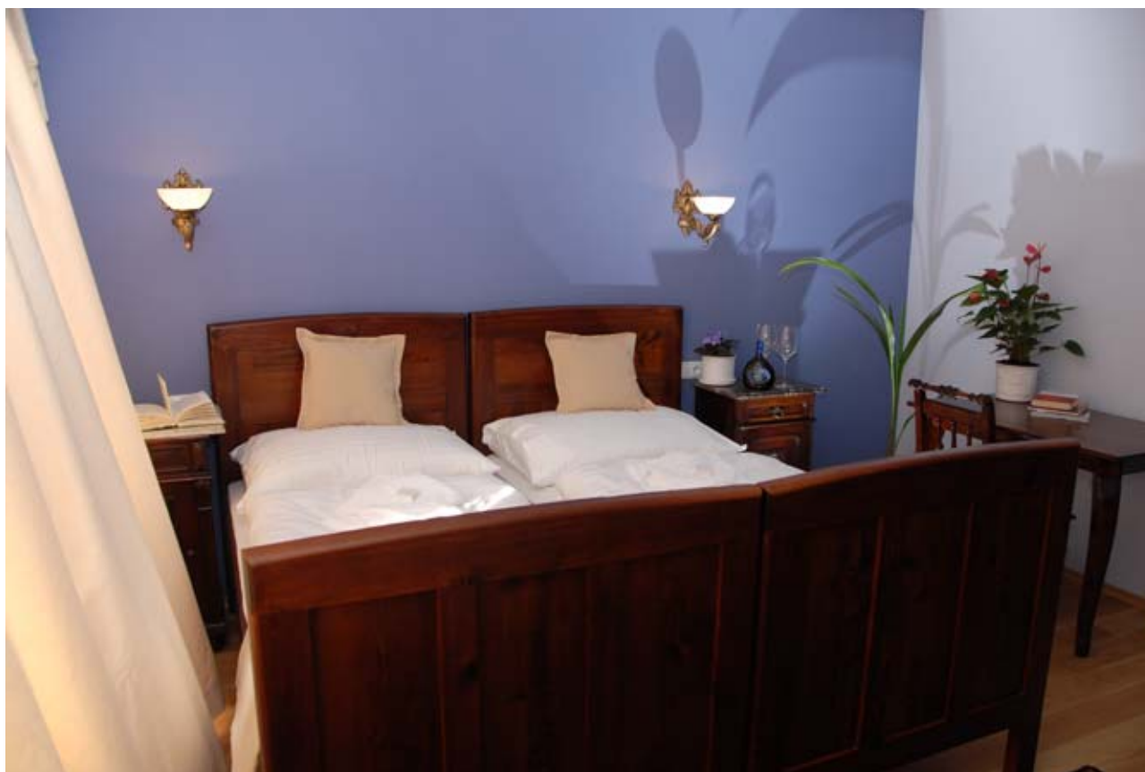
11 - Frankovka

Sedem izieb je so sprchovacím kútom, tri izby sú s vaňou. Vane sa nachádzajú v izbách: Breslava, Devín a Tokaj. Izby Breslava a Devín sú s výhľadom do námestia, ostatné izby, hlavne izby na druhom poschodí majú krásny výhľad na Bojnický zámok.