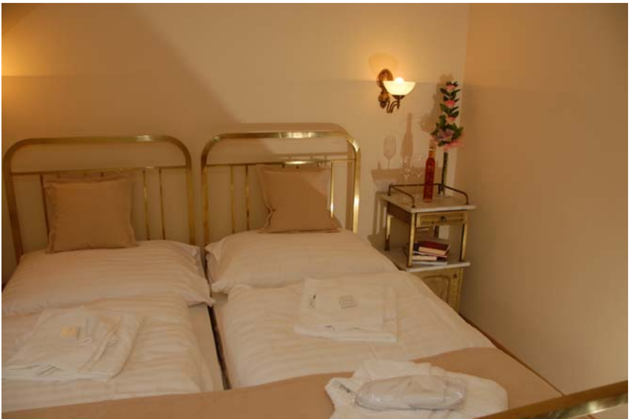
22 - Devín