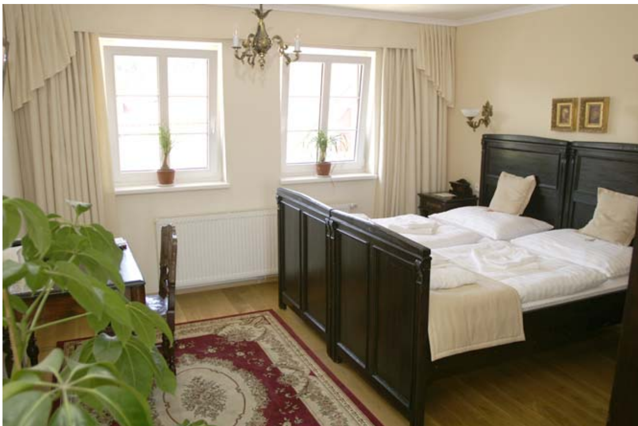
25 - Burgund