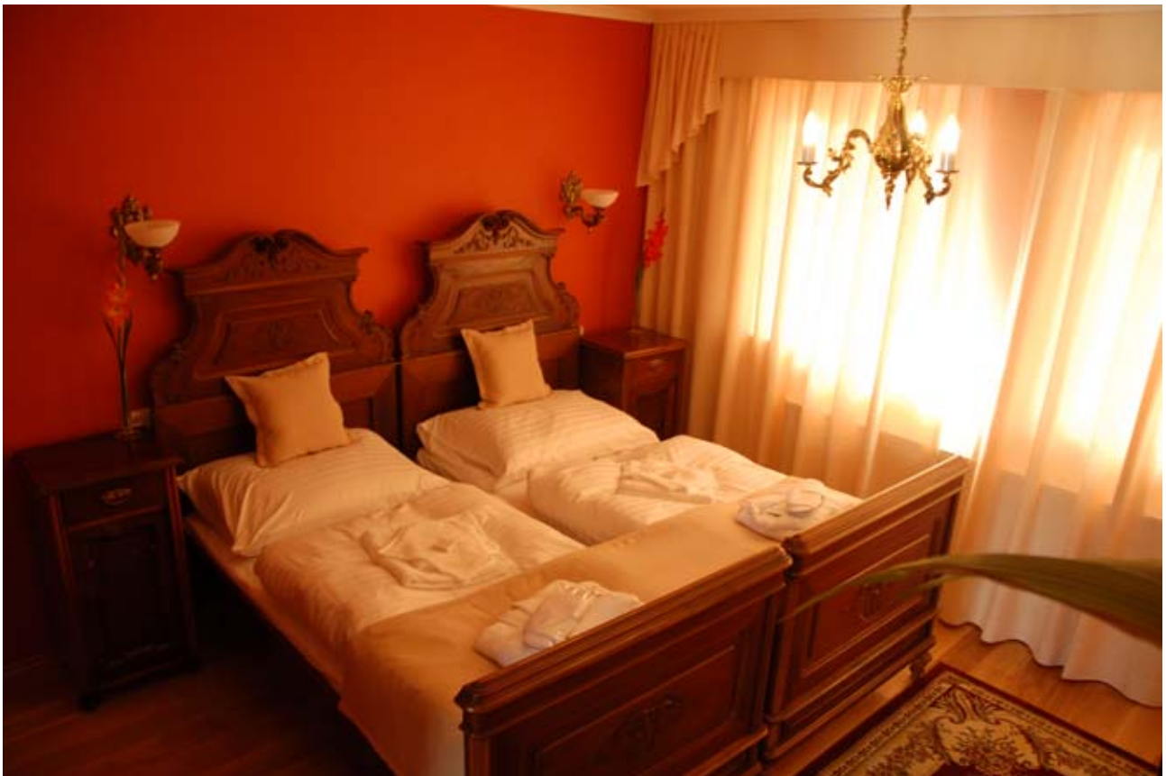
24 - Cabernet