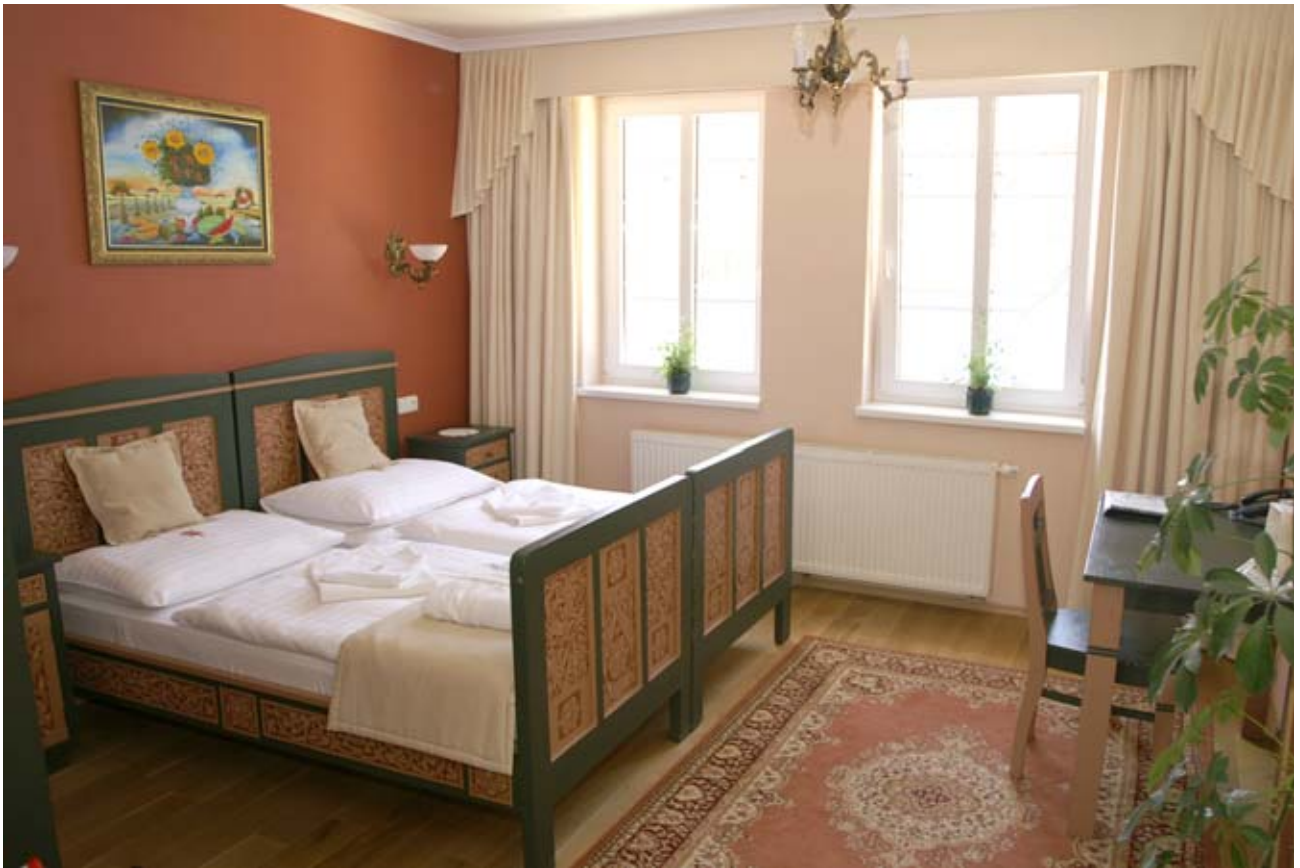
12 - Tramín